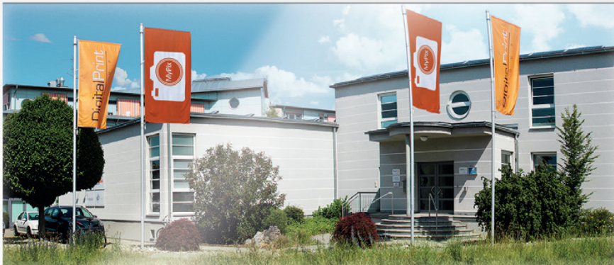
Unsere Zentrale in Nürnberg

Was 1997 als reine Digitaldruckerei „Digital Print Group O. Schimek GmbH“ begann, hat über die Jahre das Dienstleistungsunternehmen MyPix herorgebracht. Wir sind seit über einem Jahrzehnt zuverlässiger Partner für über 100.000 Kunden, die qualitativ hochwertige Fotoprodukte produzieren und versenden lassen und sind dadurch nicht nur der perfekte Ansprechpartner für Ihre Fotos, sondern auch ein erfahrener Partner für Ihre Printprodukte.