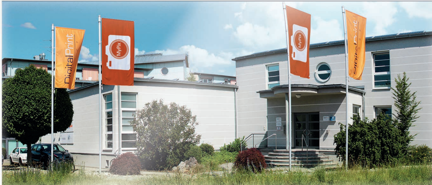
Unsere Zentrale in Nürnberg

Was 1997 als reine Digitaldruckerei „Digital Print Group O. Schimek GmbH“ begann, hat über die Jahre das Dienstleistungsunternehmen MyPix hervorgebracht. Wir sind seit über einem Jahrzehnt zuverlässiger Partner für über 100.000 Kunden, die qualitativ hochwertige Fotoprodukte produzieren und versenden lassen. Dadurch sind wir nicht nur der perfekte Ansprechpartner für Ihre Fotos, sondern auch ein erfahrener Profi für Ihre Printprodukte.